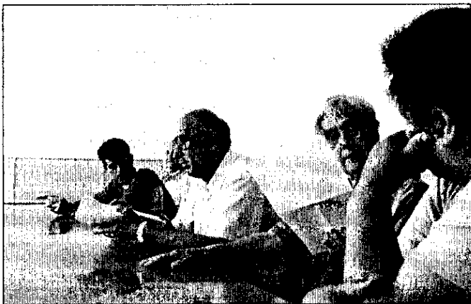
Humanitarni Centar NS/ HCNS – sa predstavljanja u Bajmoku